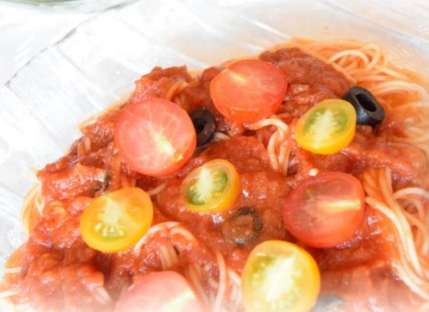
ひんやりさっぱり 冷製パスタ