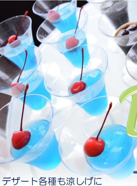
デザート各種も涼しげに