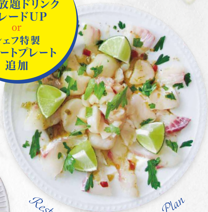
Restaurant Summer Party Plan